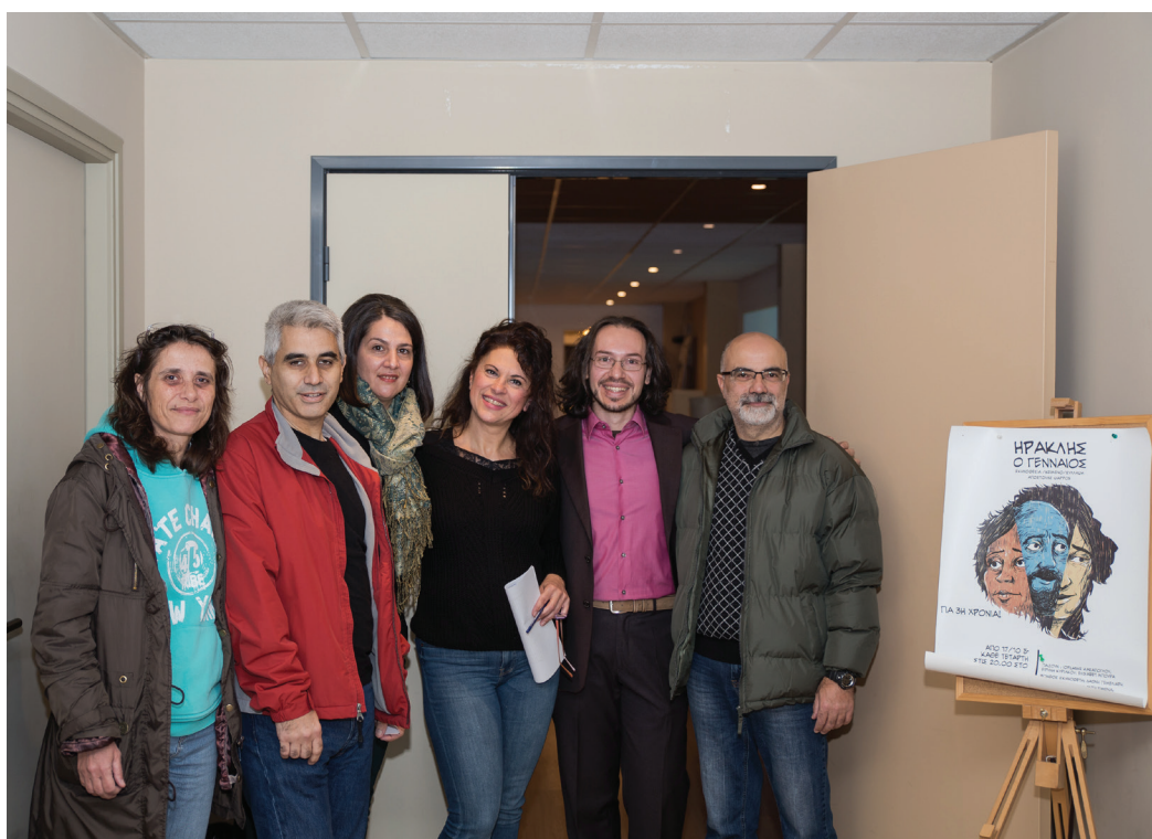
Εκδήλωση ΠΑ.ΣΥ.Φ.Α. «Χειμερινό Ηλιοστάσιο» 2018

GREEN, H. S. Mundane Astrology . RAPHAEL, Mundane Astrology .